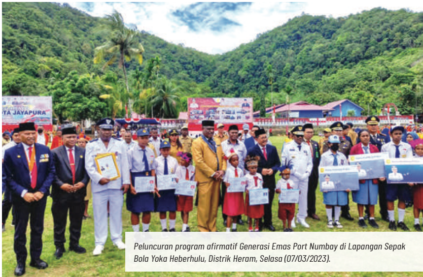
Peluncuran program afirmatif Generasi Emas Port Numbay di Lapangan Sepak Bola Yoka Heberhulu, Distrik Heram, Selasa (07/03/2023).

Berdasarkan gambaran singkat tersebut, maka diperlukan upaya dan langkah besar serta strategis dan jangka panjang untuk mengembalikan, mempertahankan, memperkuat dan meningkatkan eksistensi serta keberadaan masyarakat adat Port Numbay ditengah kemajuan dan perkembangan jaman yang sangat kompetitif dewasa ini.