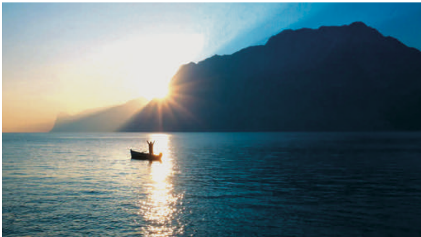
Danau Tigi Kabupaten Deiyai, Provinsi Papua Tengah